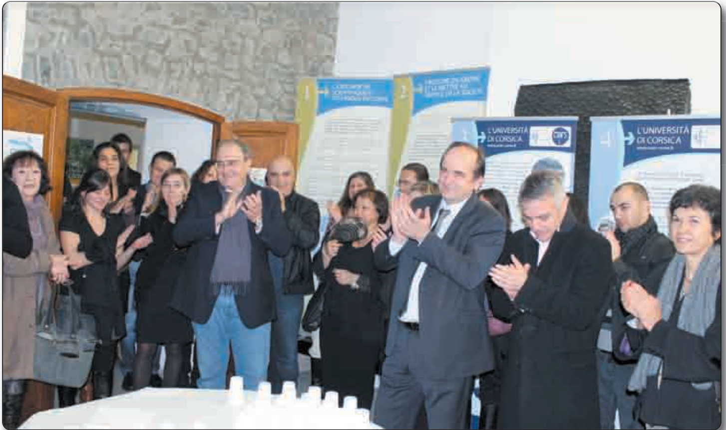
L'inauguration des locaux de la CSTI en présence de Paul Giacobbi, président de l'Exécutif de l'assemblée de Corse

L'association A Rinascita - CPIE Corte Centre Corse a été récemment positionnée par la Région et l'Etat comme nouvelle tête de réseau de la culture scientifique, technique et industrielle en Corse (CSTI).